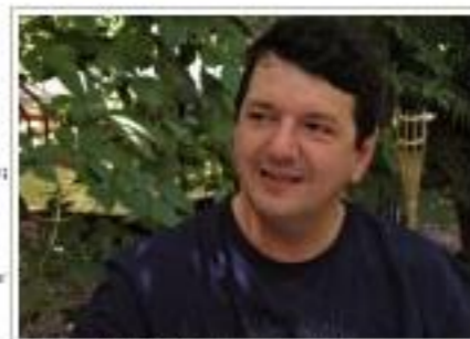
Vittorio Merlo / © wikipedia pt à l'ère merlo