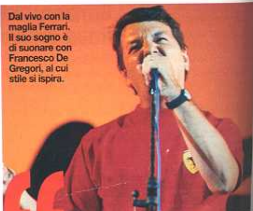
Dal vivo con la maglia Ferrari. Il suo sogno è di suonare con Francesco De Gregori, al cui stile si ispira.

Ho messo i miei brani in Rete solo per gioco, non per avere successo